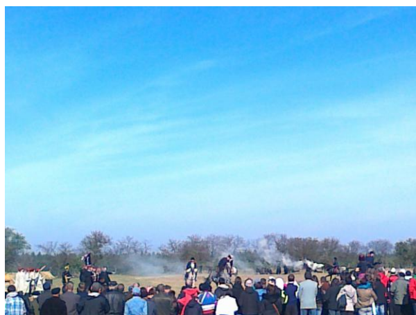
Dymy nad Melchowem