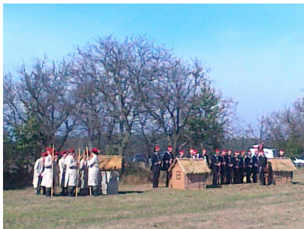
Oddziały „powstańcze” gotowe do walki