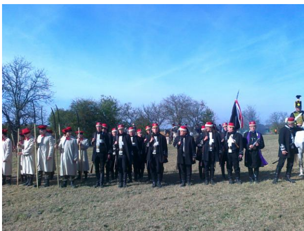
Oddziały po walce

Tekst i zdjęcia: Jerzy Sikorski, SKT PTTK przy Gimnazjum w Przyrowie