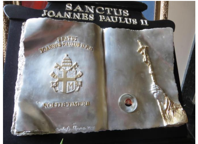
Relikwie Jana Pawła II