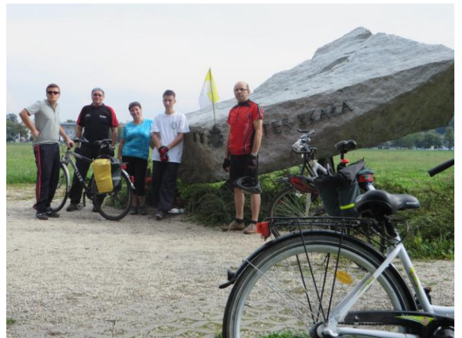
Na Błoniach Krakowskich